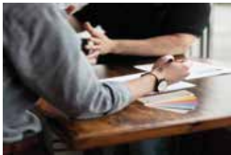
Planung und Beratung