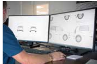
Design und Gestaltung